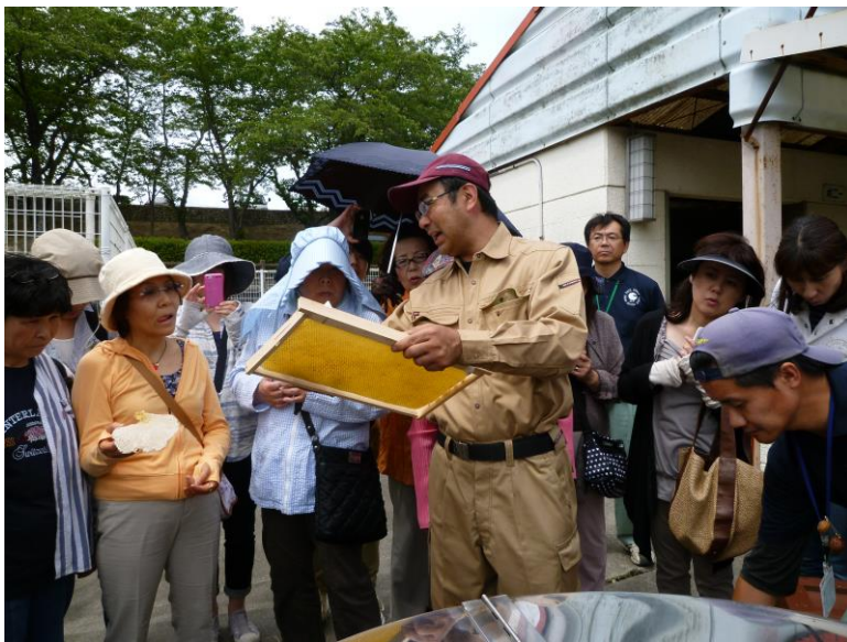
大曽公園での体験の写真です